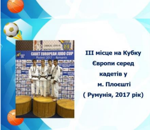
III місце на Кубку Європи серед кадетів у м. Плоешті ( Румунія, 2017 рік)