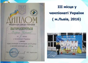
III місце у чемпіонаті України ( м.Львів, 2016)