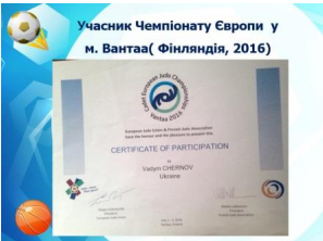
Учасник Чемпіонату Європи у м. Вантаа (Фінляндія, 2016)

П'ятниця, 09 червня 2017 08:05 - Останнє оновлення П'ятниця, 09 червня 2017 08:11