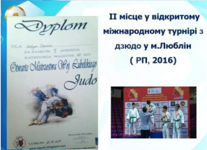
II місце у відкритому міжнародному турнірі з дзюдо у м.Люблін ( РП, 2016)