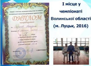
I місце у чемпіонаті Волинської області (м. Луцьк, 2016)