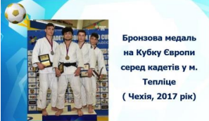
Бронзова медаль на Кубку Європи серед кадетів у м. Теплице ( Чехія, 2017 рік)