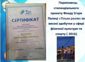
Переможець стипендіального проекту Фонду Ігоря Палиці «Тільки разом» за високої здобутки у сфері фізичної культури та спорту ( 2016)