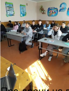
Про роботи на війні FPV, камікадзе, бомбери, розвідники та інші БПЛА - Ваколюк В.А.