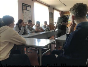
Відділ з організації безпечної роботи на підприємстві Державної служби з